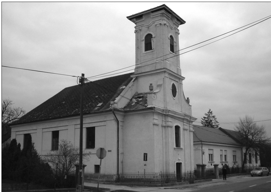
A vihar levitte a kajászói templomtorony sisakját

A református ember gyakran individuális személyiség. Ezért is alkalmas örállónak Mert bizony az örállónak gyakran egyes-egyedül kell állnia sötét éjjeleken! Nyári egyetemista katonai szölgálatom során az erdő mélyi löszerraktárt kellett fegyveresen öriznem egyik „csillagoltó sötét éjjelen”, amikor az orrom hegyéig sem láttam (így neki is mentem keményen egy éppen ott ácsorgó erdei fatörzsnek). Bizony,