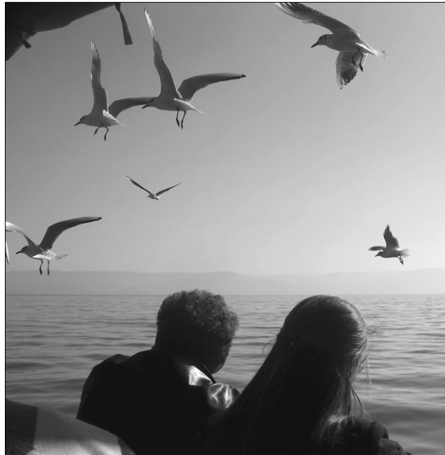
Tanítványok a Galileai-tavon

pl. sok százazres rendezvényre igyekeztünk mindenfelől, vagy ha éppen ott voltunk mi magunk is.