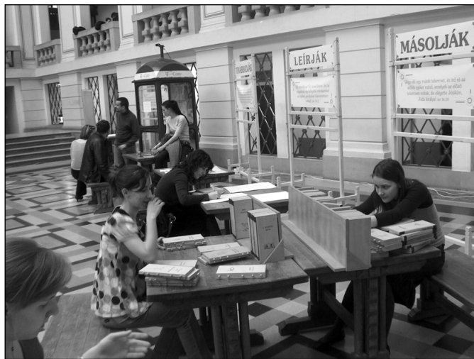
A 66-os út interaktív Bibliakiállítás Debrecenben