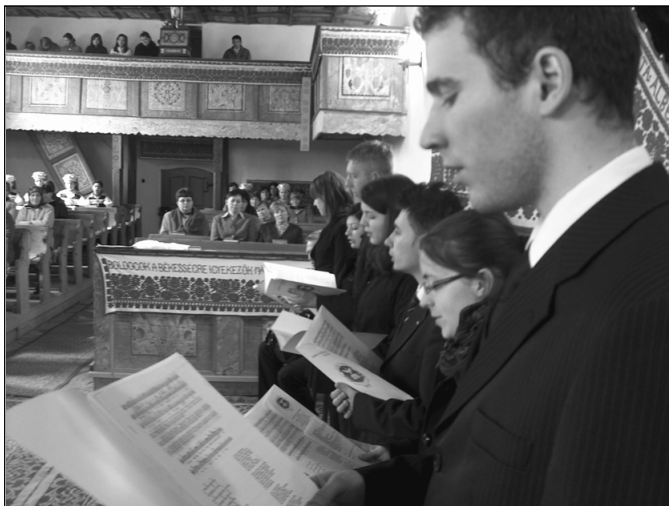
A körösfői templomban