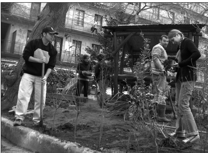
Folytatódik az udvar parkosítása