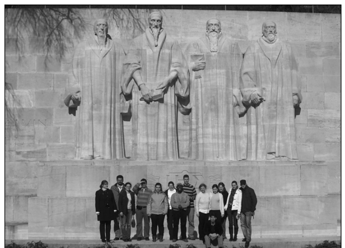
Tanulmányi kirándulás Genfben

Rendszeresen volt a teológián ún. képmeditáció , ahol a diákok – tanárokkal együtt – kereshették egy-egy képzőművészeti alkotás üzenetét, megfigyelhették azt teológiai, esztétikai szempontból.