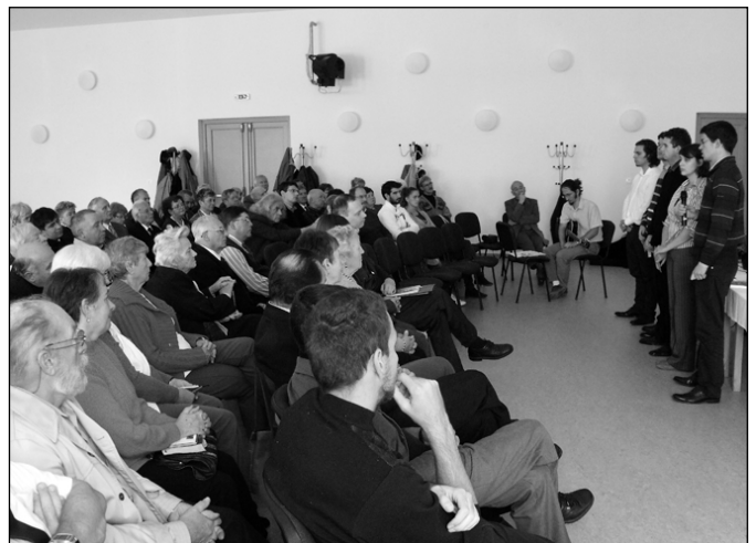
Teológusok a tolnai presbiteri konferencián