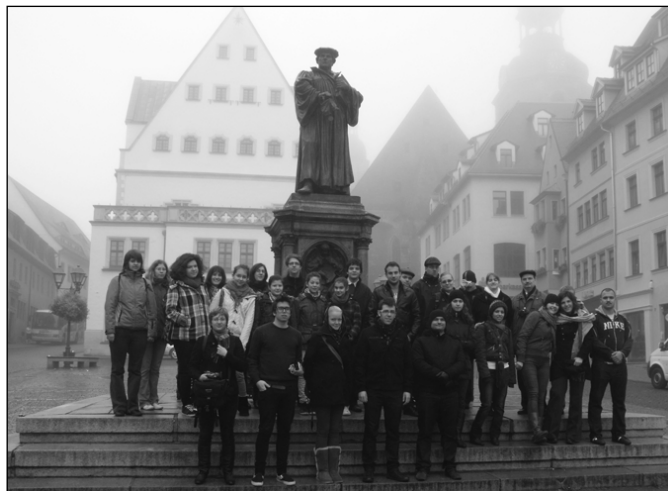
A ködös Eislebenben

Az elmúlt nyáron is több építőtábort szervezett az Alapítvány, ezek során Gyulafehérváron és Alvinczton (Erdély) (villámcsapás során leégett a parókia-gyülekezeti ház) munkálkodtak, ide az őszi folyamán is visszatértek hallgatók. Felépült a szörványiskola csűrje és rendeződött az udvar Felőrön (Erdély) a protestáns szakkollégium hallgatóinak munkájával. A kalotaszegi Zsobokon gyermekotthonosoknak szerveztek tábori teológusok, csakúgy, mint a vajdasági Módoson , ahol nagy hangsúly esett a hagyományörzésre. A felvidéki Körösön (Rozsnyó mellett) fizikai munkát végeztek a teológusok, folytatták a gyülekezeti ház felújítását és a fakitermelésben is részt vettek.