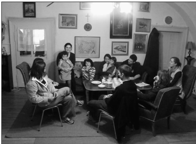
A magyarigeni parókián