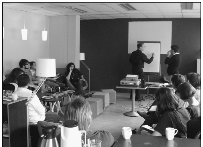
Előadás a gyülekezetplántálásról Amszterdamban