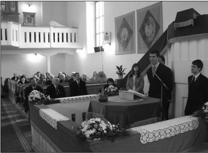
Teológusok szolgálata Gödöllőn