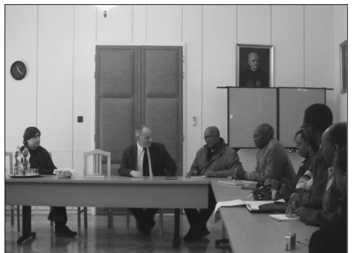
Kenyaiak Szabó István püspöknél