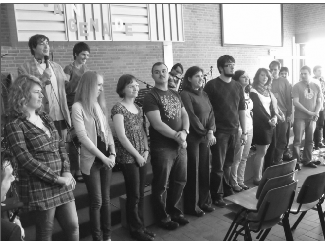
Rövid bemutatkozás a Hoop voor Noord gyülekezetben, Amszterdamban