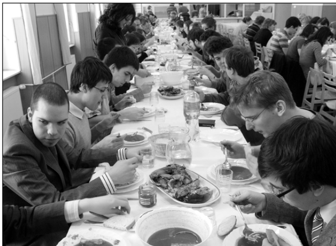
Bajaiak halászlével vendégelték meg a teológusokat